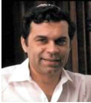
Eliyahu M. Goldratt