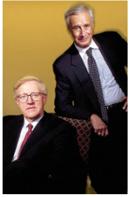
Robert S. Kaplan & David P. Norton

Je systém strategického riadenia, ktorý pomáha plánovať, riadiť a kontrolovať dlhodobý vývoj podniku.